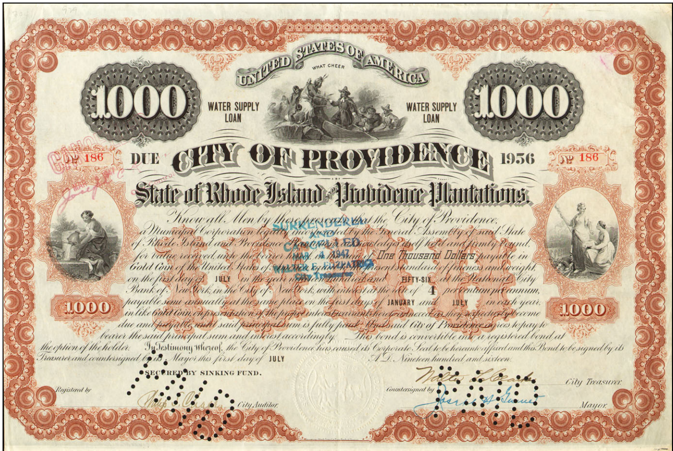
Y1636 – Dluhopis City of Providence vydaný za účelem výstavby vodovodu 1. července 1916 na 1.000 USD, tisk American Bank Note Co.

O neustálé potřebě peněz pro veřejné rozpočty se u nás mluví snad odjakživa. Právem, protože na veřejné projekty byly peníze třeba v minulosti stejně jako dnes. Kromě státu pravidelně potřebují peníze také municipality. Bývalo zvykem, že se dluhopisy pro veřejnost vydávaly jen na konkrétní potřebu, nikoli jako dnes na často bezúčelné projekty či dokonce na úhradu starší dluhů, tedy jen k tomu, aby se zaláhal schodek v rozpočtu.